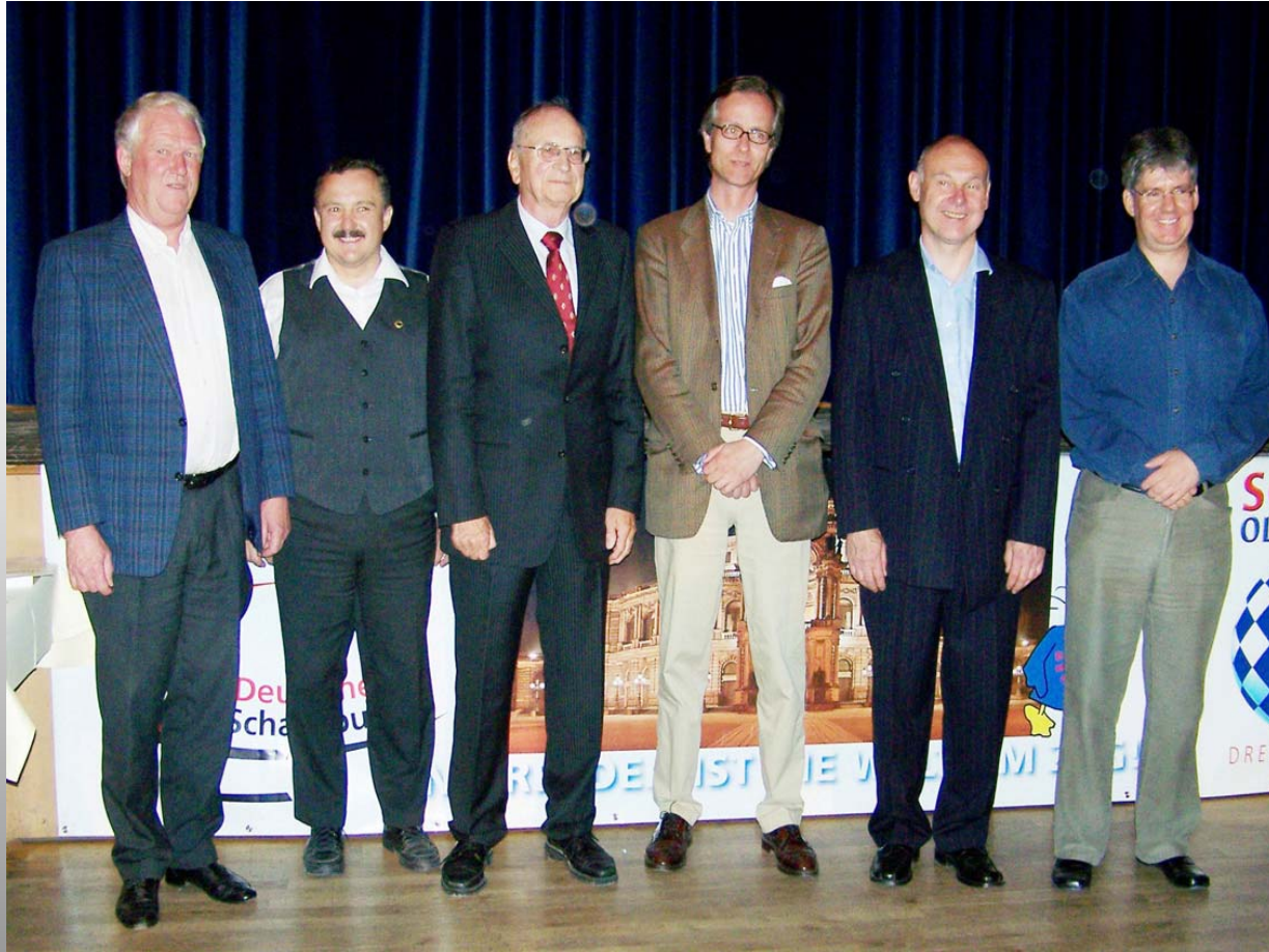
Sieger der XIII. FS-Olympiade