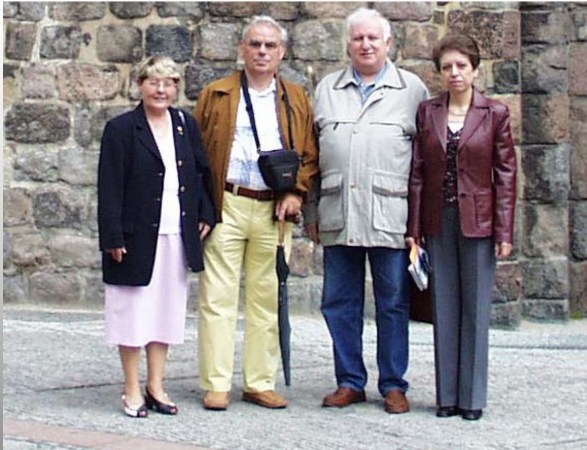
GM Semen Pinkovetski (RUS)